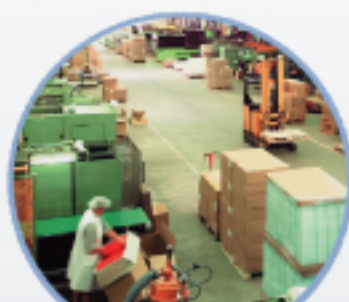
專業的物流中心，運籌全球