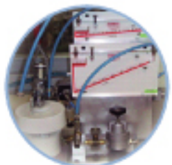
每顆吸氣閥須經 15000 次氣密測試及兩種封裝檢驗 提供最佳品質與完善的品質防護