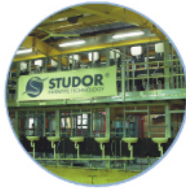
澳洲 TAFE STUDOR 產品功能驗證中心