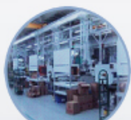
美、歐、亞洲均設有生產中心 提供各區即時完善的配運服務