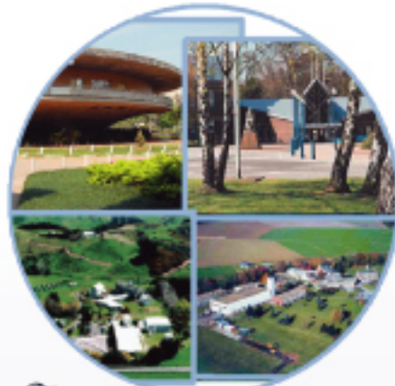
STUDOR 於歐、美、亞均有建築 / 研發技術中心 排水通氣專業技術領先全球